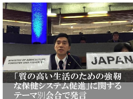
「質の高い生活のための強靱な保健システム促進」に関するテーマ別会合で発言

農林水産省を代表し、第 6 回アフリカ開発会議へ安倍総理と共にケニア・ナイロビに行ってまいりました。