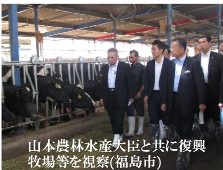
山本農林水産大臣と共に復興牧場等を視察(福島市)